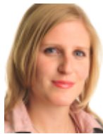
Anne Riedler Kleinwalsertal Tourismus